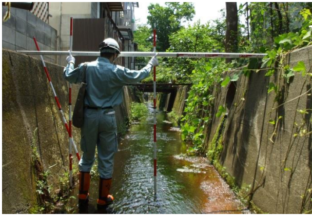
公共土木施設の定期点検