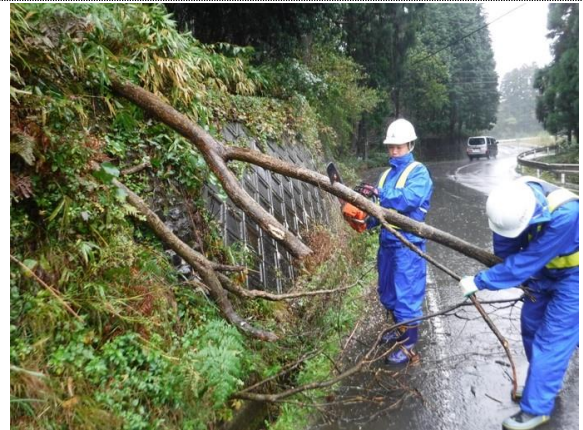
災害発生時の緊急復旧