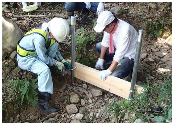
市民協働による維持管理の取組（土留めの設置）