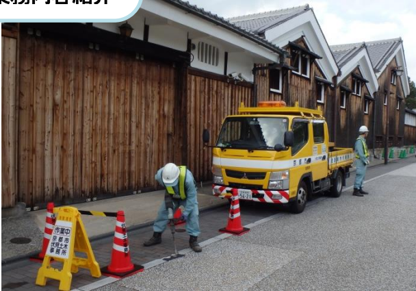
パトロールにより発見した損傷箇所の修繕